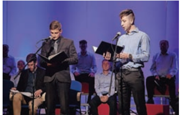
Člani cerkljanskih društev so pripravili pester kulturni večer, posvečen Aškercu in Trubarju.