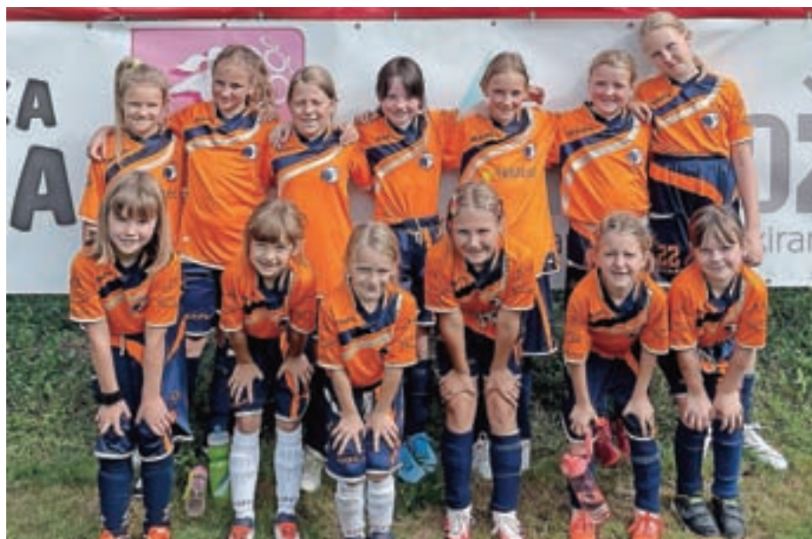
Tudi nogometašice so v jesenskem delu tekmovanj dosegale lepe uspehe.

Če rezultatsko povzamemo jesenski del sezone 2021/2022, smo ponosni na vse naše ekipe. Članice v SŽNL ob petih zmagah in 15 točkah zasedajo odlično peto mesto; ob zaostali tekmi z 12 točkami peto mesto zasedajo tudi kadetinja. V tekmovanju lige DU15 ob zaostali tekmi ekipa U15 zaseda odlično drugo mesto, za prvo ekipo zaostajajo s tekmo manj za tri točke. Prav tako so bile aktivne tudi deklice ekipe U13, ki so se udeleževale turnirjev lige DU13. V omenjenem tekmovanju svoje znanje prikazujejo dekleta, stara 11 in 12 let, po jesenskem delu zasedajo drugo mesto lige DU13 – zahod. Seveda ne smemo pozabiti na ekipi U10 in U12, ki uspešno nastopata v ligah MNZG. Naše najmlajše pa se udeležujejo turnirjev Rada igran nogomet, kjer se prvič srečajo z vrstnicami iz drugih klubov. Veseli smo tudi deklic iz vrtcev, ki že pridno brcajo žogo in seveda iščejo svojo gibalno vsestranskost v športu. Kar nekaj deklet je bilo to jesen vključenih tudi v mlajše reprezentance, ki Ženski nogometni klub Cerklje zastopajo na mednarodnem nivoju. Glede na veliko število deklet in ekip se še vedno srečuje-