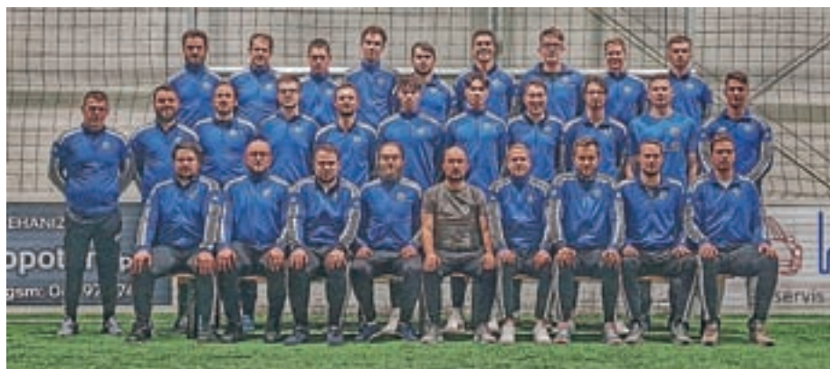
Članska ekipa za sezono 2021/2022

Nogometni klub Velesovo Cerklje je leto, kljub težavam, povezanimi z epidemijo, uspešno prebrodil in iz njih izšel še močnejši in uspešnejši. V Velesovo se je po nekaj letih znova vrnila nogometna evforija, kar je predvsem posledica uspešnih nastopov članske ekipe, ki je po jesenskem ligaškem delu tik pod vrhom lestvice z možnostmi za naslov prvaka in napredovanje v višji rang tekmovalja. Veseli nas, da je ekipa mlada in sestavljena večinoma iz domačih igralcev, kar pomeni, da je pred njo še lepa prihodnost. Navdušujejo pa tudi mlajše selekcije, ki v svojih starostnih kategorijah po jesenskem delu tekmovalj posegajo po najvišjih mestih. Vse to je posledica sistematičnega dela v zadnjih treh letih in tega, da nam je v klub uspelo privabiti odlične trenerje, ki verjetno sestavljajo trenutno najboljšo trenersko ekipo na Gorenjskem, kar nam priznavajo tudi drugi klubi. Ravno zaradi odlične trenerske ekipe in pozitivne klime v klubu so nas iz NZS kot