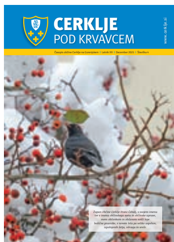
Na naslovnici: Zimska idila