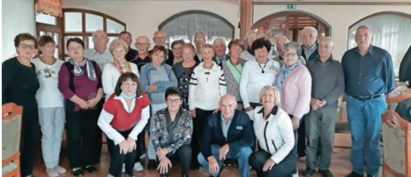
Del članov društva