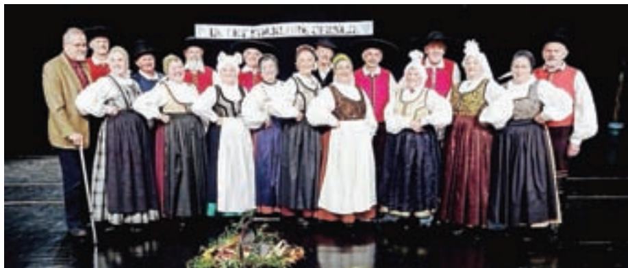
Skupinska fotografija cerkljanskih folklorikov, tudi prejemnikov Maroltovih značk